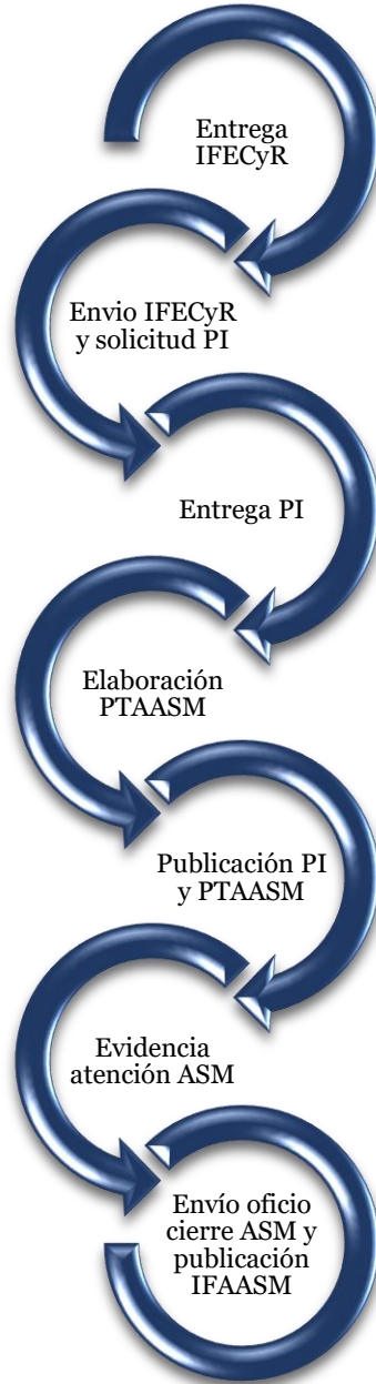
Figura 2. Proceso ASM.